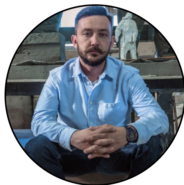
Евгений Тетерин Скульптор