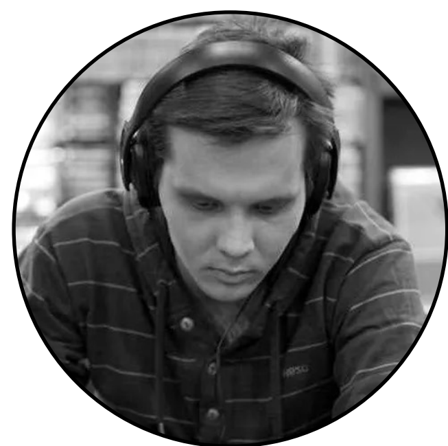
Виктор Семёнов Саунд дизайн